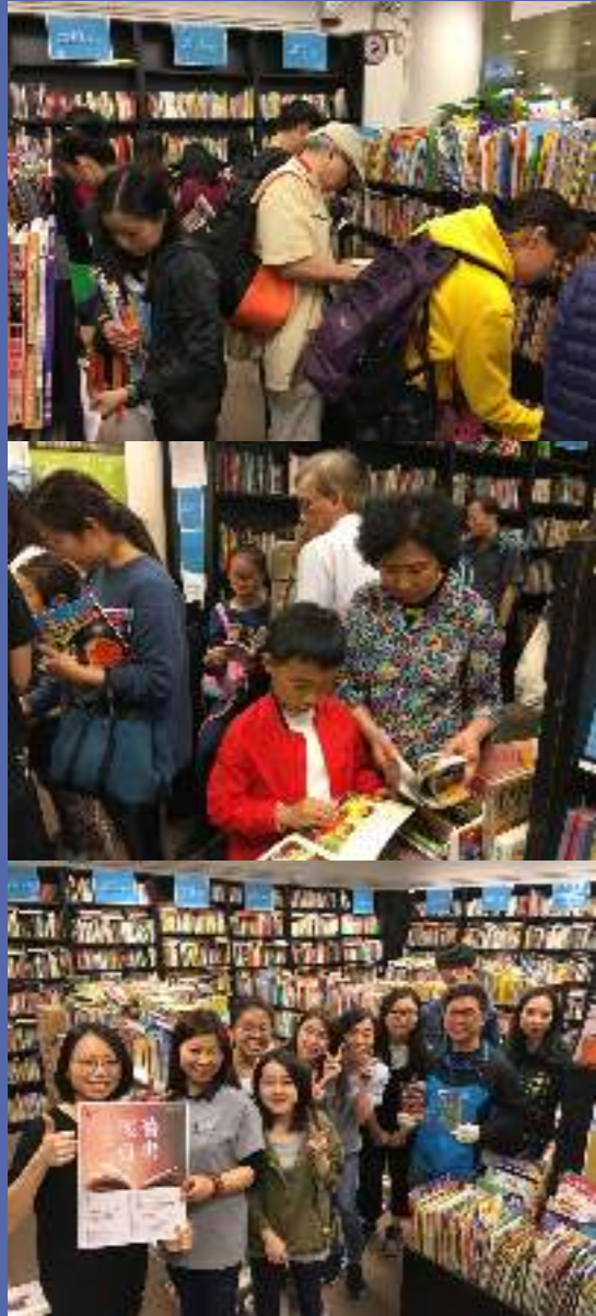
「書送祝福」舊書義賣活動

沃土社與商務印書館於2018年合辦「書送祝福 讓知識承傳」舊書慈善義賣活動，把從各門市收集得來的中外書籍集合後，分別於3月22日至4月19日期間，在紅磡文化快線門市及香港中文大學書店文化活動廳義賣，所有書籍一律每本港幣10元，籌得的善款扣取行政費用後，將全數撥捐本社及小童群益會。本社將把善款用於助學計劃，協助湖南湘西及貴州貧困山區學童，讓他們可以無憂無慮地背起書包上學去。