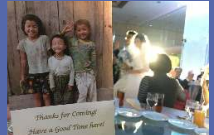
慈善婚宴「婚·享」計劃

沃土社於2017至2018年度繼續獲香港商務印書館及三聯書店（香港）有限公司支持，允許我們在旗下共26間門店收銀處擺放籌款箱及宣傳小冊子，藉此得到眾多市民踴躍捐款，同時也提供機會讓更多市民認識沃土社的服務。