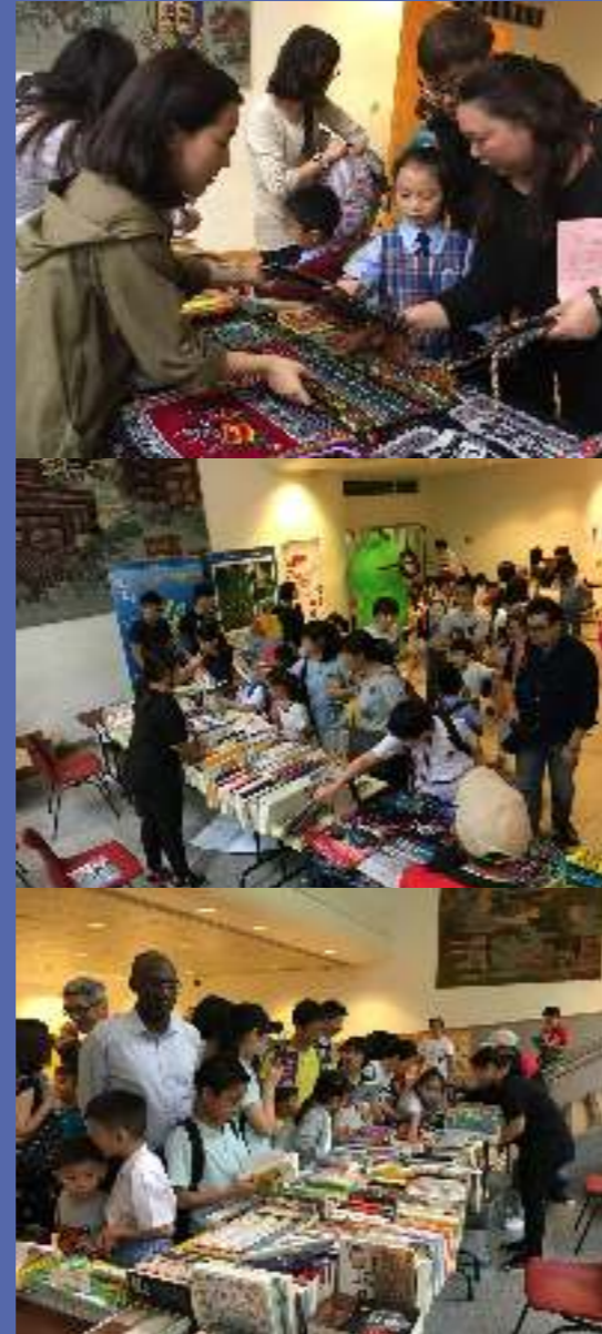
「樂善好施書」義賣籌款活動

沃土社與商務印書館於2018年合辦「書送祝福 讓知識承傳」舊書慈善義賣活動，把從各門市收集得來的中外書籍集合後，分別於3月22日至4月19日期間，在紅磡文化快線門市及香港中文大學書店文化活動廳義賣，所有書籍一律每本港幣10元，籌得的善款扣取行政費用後，將全數撥捐本社及小童群益會。本社將把善款用於助學計劃，協助湖南湘西及貴州貧困山區學童，讓他們可以無憂無慮地背起書包上學去。