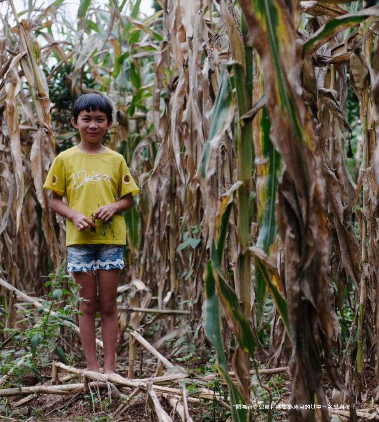
*圖為留守兒童社區築夢項目的其中一名受惠孩子