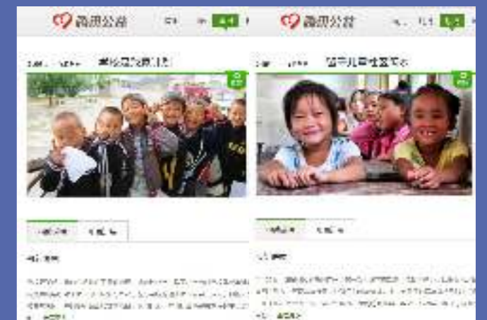
內地騰訊公益眾籌平台

沃土社本年度最新推出「婚·享」婚宴回禮轉贈計劃，把回禮小禮物化作愛心捐款，幫助內地貧困農村的有需要人士，為一對新人的婚禮加添意義！