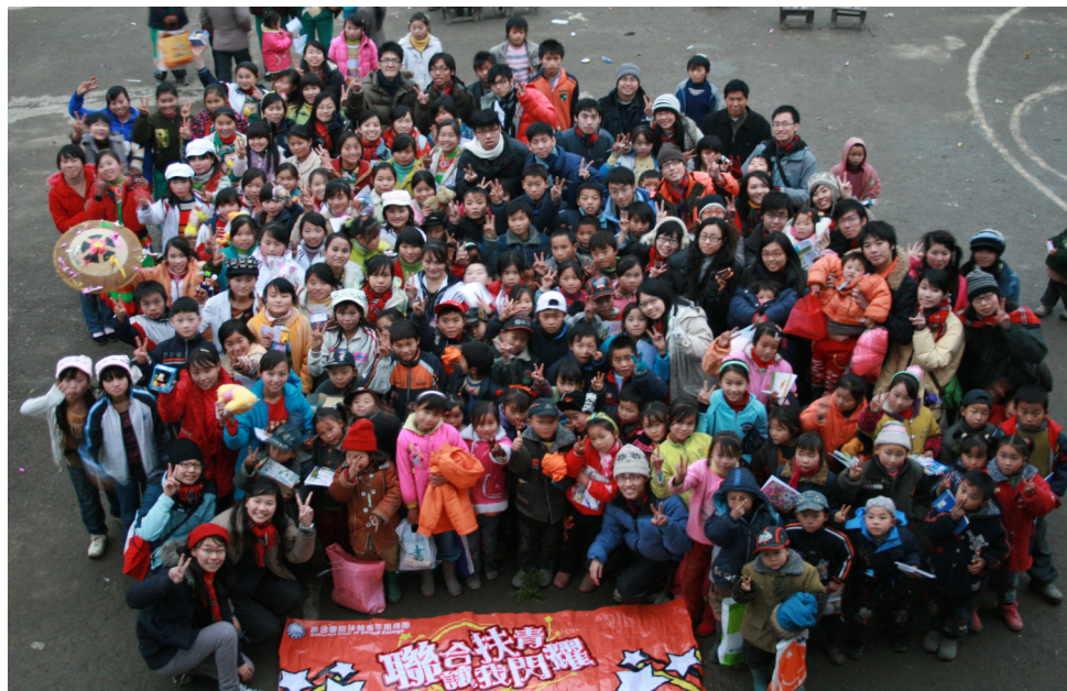
山區少數民族探訪團 - 義工與學童大合照

沃土社與中文大學聯合書扶輪青年服務團首次合作，於 2007 年 12 月 26-2008 年 1 月 1 日期間前往湖南山區探訪學童及送上溫暖。