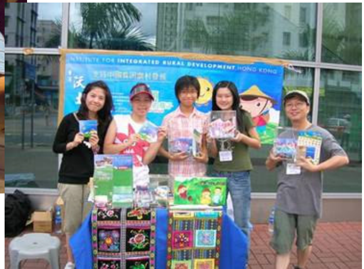
貧困湘西山區籌款活動(大圍火車站)