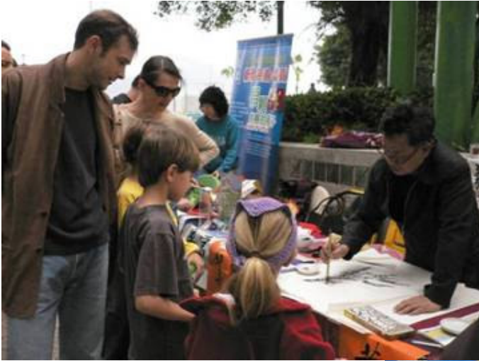
新春慈善義賣(赤柱廣場)

我們必須感謝過去一年參與義工努力不懈的向市民大眾募捐，目的為貧困湘西山區兒童籌募助學及醫療經費。