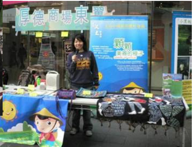
領匯商場慈善籌款活動(將軍澳厚德商場)