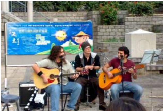
嶺南大學籌款活動 - 街頭音樂會

於 2007 年 10-12 月期間，沃土社與嶺南大學合作舉行「公共衛生特工隊 - 駐校村醫經費募捐籌款活動及社區為本研究 - 「沃土發展策略計劃」。