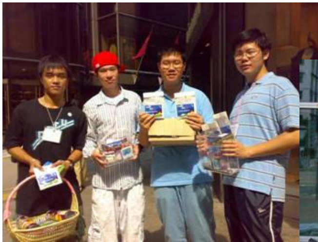
貧困湘西山區籌款活動(佐敦地鐵站)