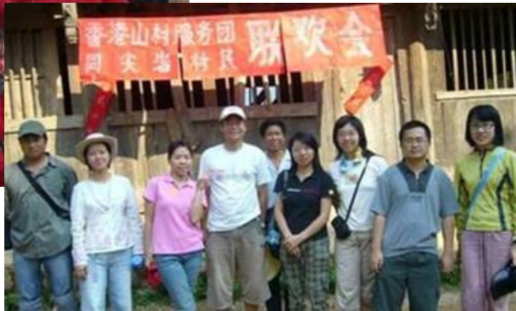
夏季山區探訪服務團 - 探訪尖岩村