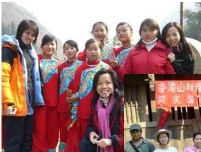
新春山區探訪服務團 - 探訪排沙村

於 2007 年 1 月、5 月、8 月及 12 月舉行貧困山區服務團，帶同義工親身抽樣探訪助學學童。