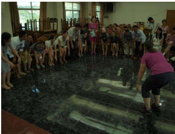
香港的義工導師鼓勵學員使用活動式教學方法，增加學習英語的趣味

和過往的培訓營一樣，參加者費用全免，學員需要全程使用英語溝通。訓練營旨在透過遊戲、歌唱和活動等方式為主的教學方法，提升學員的英語教學能力。每位學員參加培訓營前須自行在學校或校區內組織英語教學小組，並於培訓營結束後舉行一系列活動，以實踐和推廣培訓營所學所得的英語教學技巧，令未能參與培訓的教師也能受惠。每位元學員完成課程後，需要帶領自己的英語教育小組編寫教材、設計及領導最少一項培訓活動。參加者共組織了 53 個教育小組，總人數達 175 人。培訓營結束後，參與本屆培訓營的老師即回到各自的學校，著手組織自己的英語教育小組推廣工作，把在訓練營所學得的英語教學技巧與成員分享。