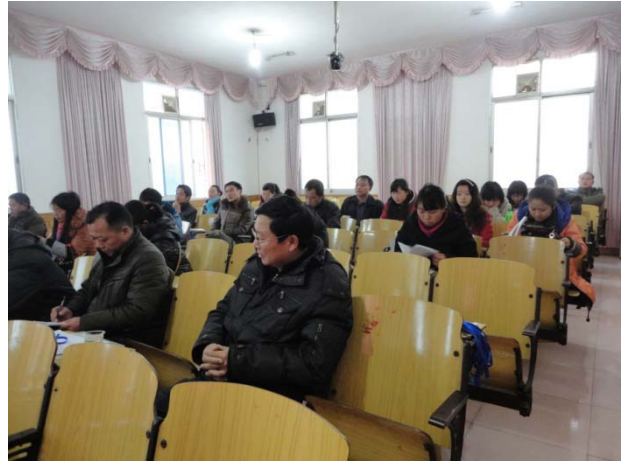
保靖縣義工第一次見面簡介會

過去一年，全賴沃土社的顧問、捐贈者和義工的支持， 使我們能夠繼續在偏遠的農村中為村民提供基本的醫療及教育服務。