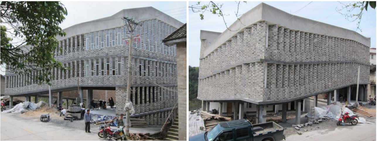
醫院大樓已基本完工，準備於 2014 年 4 月 29 日正式開幕投入服務。 (2014 年 3 月 31 日)