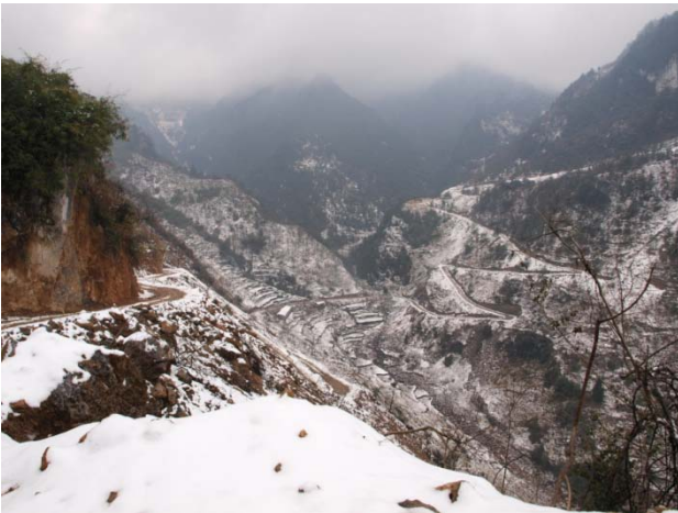
沙灣村位處偏遠山區

湖南省保靖縣碗米坡鎮沙灣村是少數民族土家族其中一個發源地，有豐富的民族文化傳統。沙灣村位處偏遠山區，經濟及交通條件非常落後，部份村民三餐也未得溫飽。大部份村民唯有出外務工，留守兒童、空巢老人問題相當普遍，是全保靖縣最貧困的村落之一。沃土社希望透過本計劃，改善村民基本生活條件，發揚本村豐富的土家族文僸遺，建立穩健經濟基礎，促進沙灣村經濟、文化、醫療及教育的綜合發展。本項目的長遠目標，是透過針對性的投資和建立著重社區參與、推崇民主協商的合作社及工作小組，結合沃土社的項目特點和強項，為貧困山區農村探索可持續的綜合發展模式。