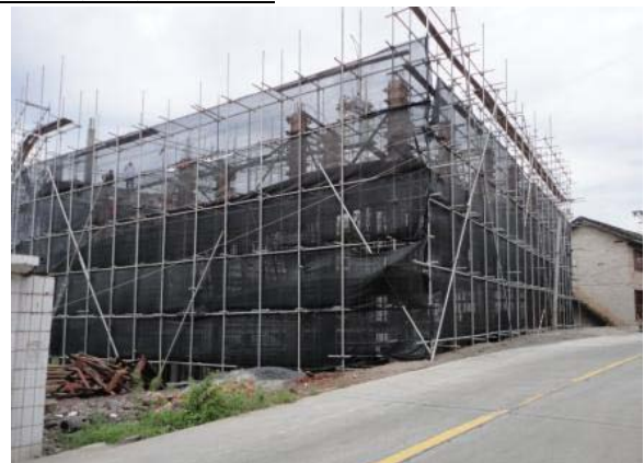
工地情況 (2013 年 8 月 30 日)