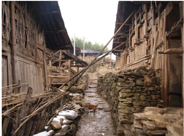
大部份村民住在殘破的木房裡