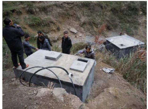
中心村中心小學新建的蓄水池及過濾池，可同時供應食水予村內居民