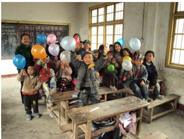
和村小學生玩遊戲