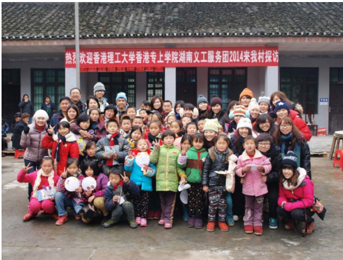
探訪清水坪鎮夕東村

服務團在歡樂的氣氛下圓滿結束。同學們享受與農村小孩相聚的時光，但更難以忘懷的是行程中探訪過的貧困家庭和中國社會發展滯後的一面。希望服務團的體驗可使同學們有所得著和反思。