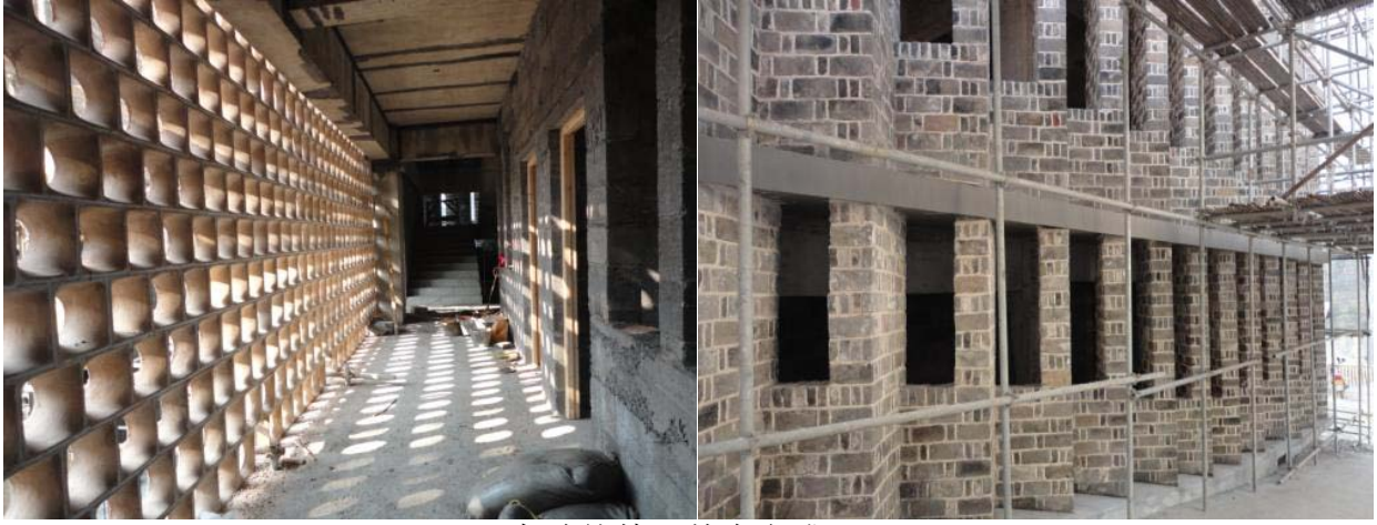
青磚外牆已基本完成。 (2014 年 1 月 20 日)