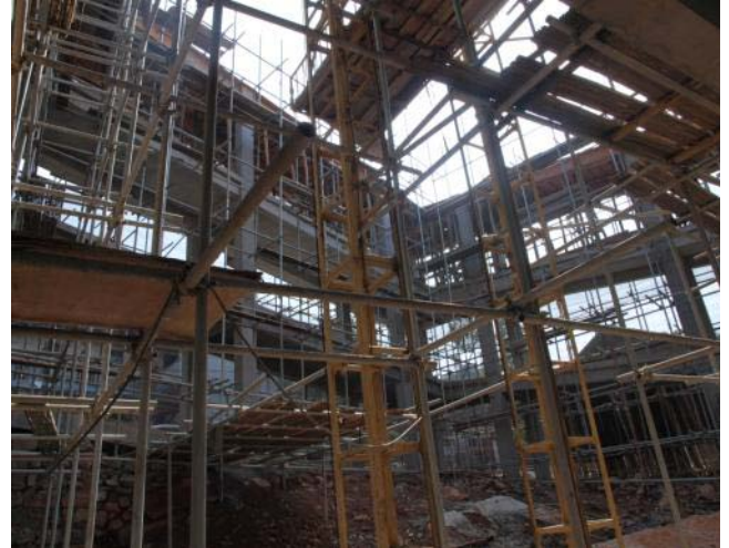
大樓框架開始成型 (2013年9月15日)