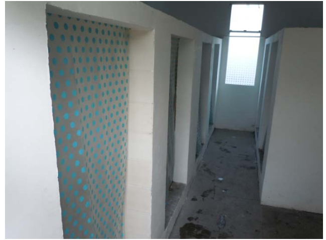
昂洞小學新建浴室