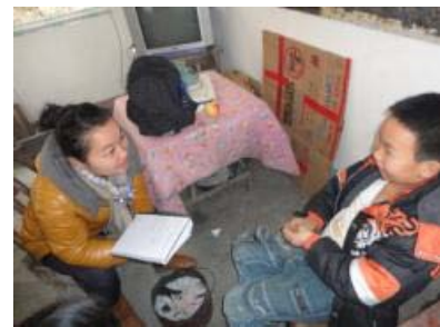
為 47 位留守兒童、2 位孤兒和 5 位單親孩子提供個人輔導

本社未來計劃從學校宿舍活動和管理系統入手，讓住宿校內的留守兒童同樣也能受惠。相信這一系列的服務可使孩子得到適當的關懷和照顧，同時令身在外地工作的父母更加安心。