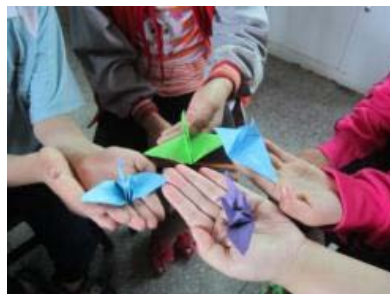
為村內留守兒童組織 7 次活動