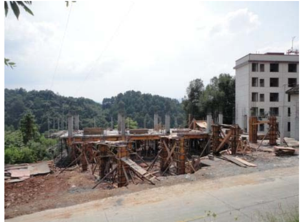
工地情況 (2013 年 7 月 15 日)