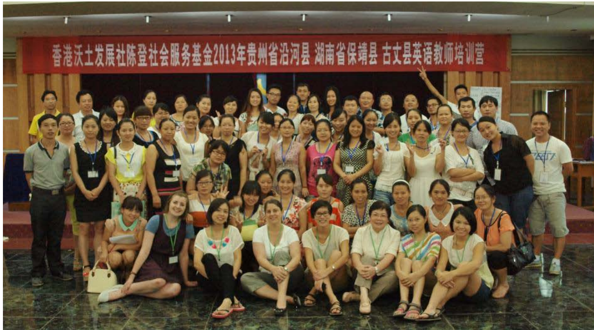
本屆英語教師培訓營全體合照

第六屆英語教師培訓營於 2013 年 7 月 22 日至 7 月 26 日再次假貴州省沿河縣舉行。培訓營共有 7 名香港義工培訓導師、18 名來自湖南省保靖縣、5 名來自湖南省古丈縣及 34 名來自貴州沿河縣，共 57 位農村學校英語老師參加，當中 10 名為中學老師，其餘 47 名為小學老師。