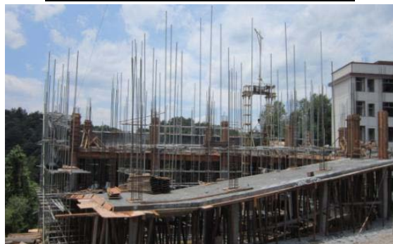
興建中的斜坡通道 (2013 年 8 月 5 日)