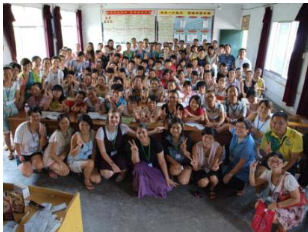
培訓導師和學員一同到貴州沿河當地學校進行示範課，鼓勵學員實踐應用培訓營所學