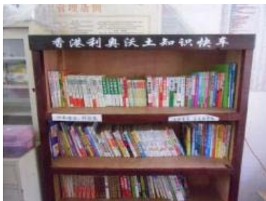
回訪 10 個村落設置的圖書室，添置及替換圖書

留守兒童一般缺乏家人關心照料，容易結識壞朋友及養成不良習慣，如聯群結黨破壞甚至犯罪，引伸眾多社會問題。自 2010 年起，本社於保靖縣通過推行「好書來我家」計劃，開展了以下針對留守兒童的服務：