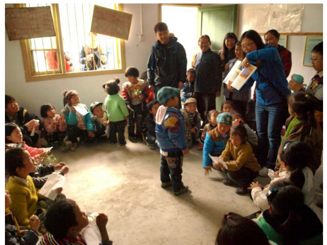
在沃土設立的村圖書室和村內小朋友玩遊戲