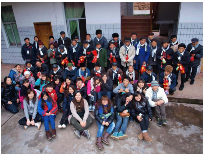
探訪碗米坡鎮敬老院