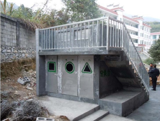
碗米坡小學新建垃圾圍由香港非牟利建築師事務所「多磨建社」設計，鼓勵學生從小養成垃圾分類的習慣