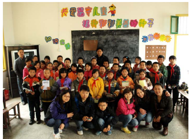
花橋小學留守兒童關愛室